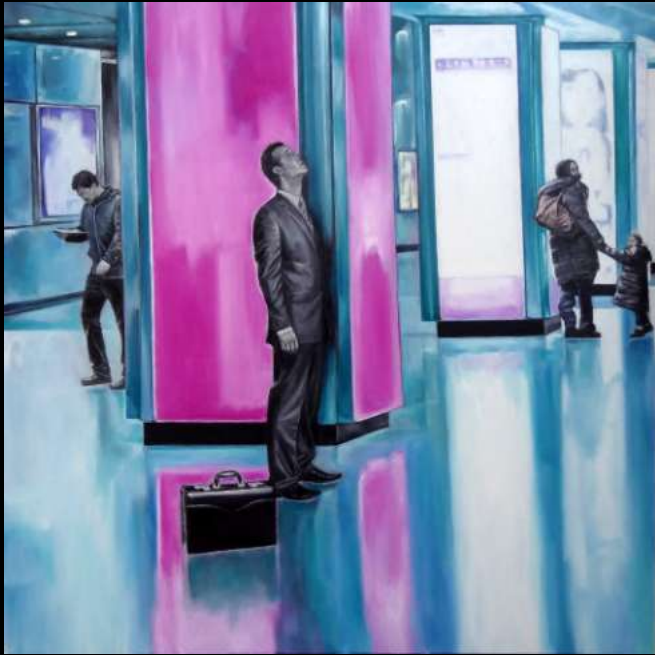
Les Divergents, 2016 huile sur toile 120x120 cm