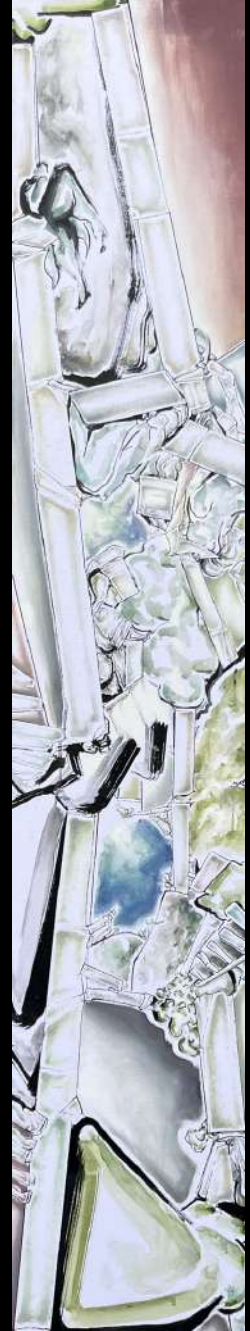
Post-anthropocène, 2025 techniques mixtes sur toile, 30x165 cm