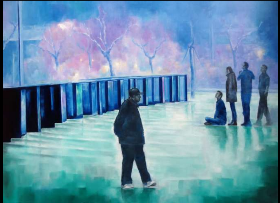
Les Divergents, 2017 huile sur toile 130x97 cm