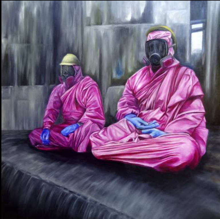
The magenta monks , OrdinaryLives, 2015 huile sur toile 100x100 cm