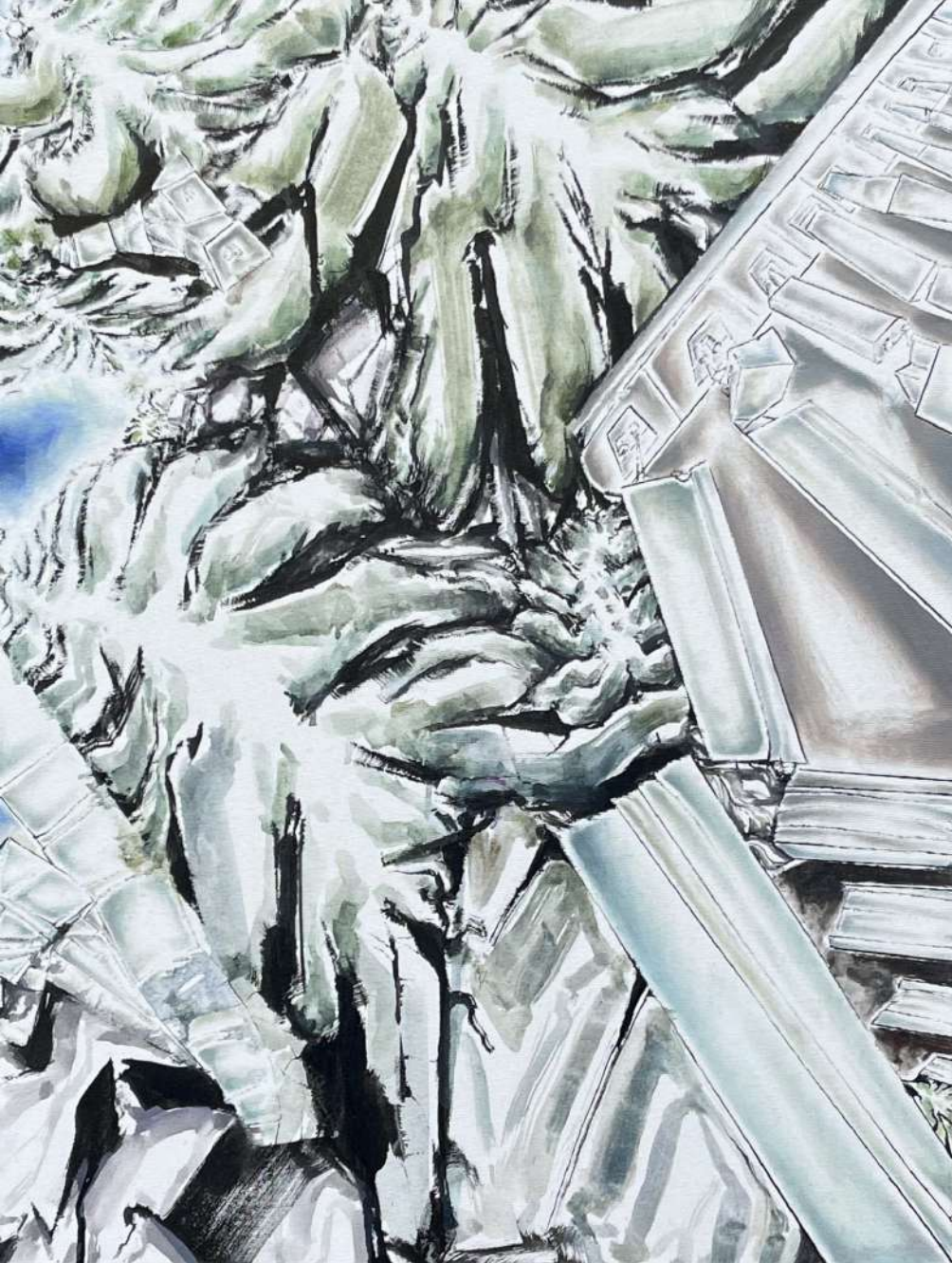
Post_anthropocène, 2025 techniques mixtes sur toile, 65x50 cm