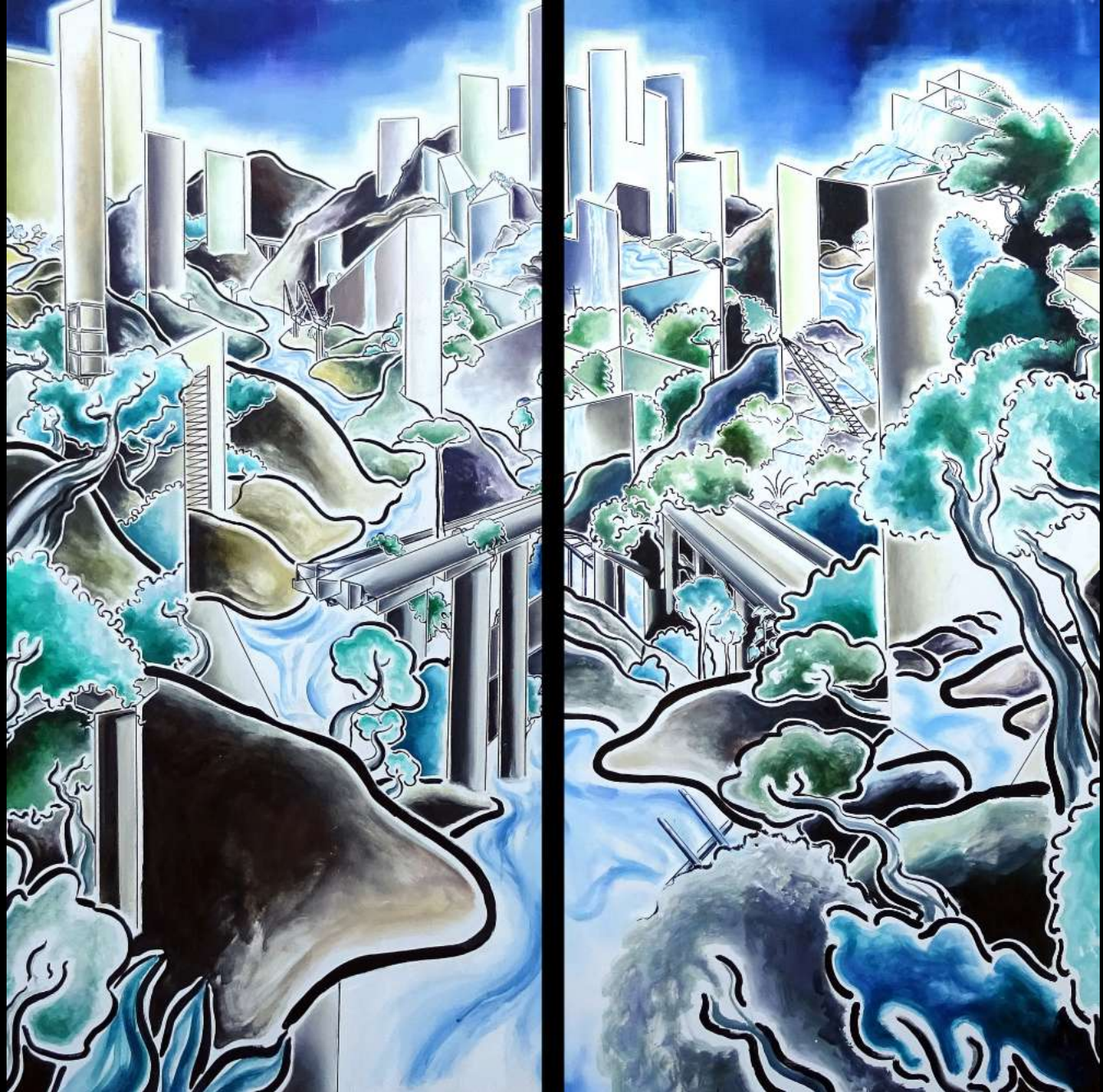
Post-anthropocène, Dyptique, 2023 Techniques mixtes sur toile, 194x212 cm