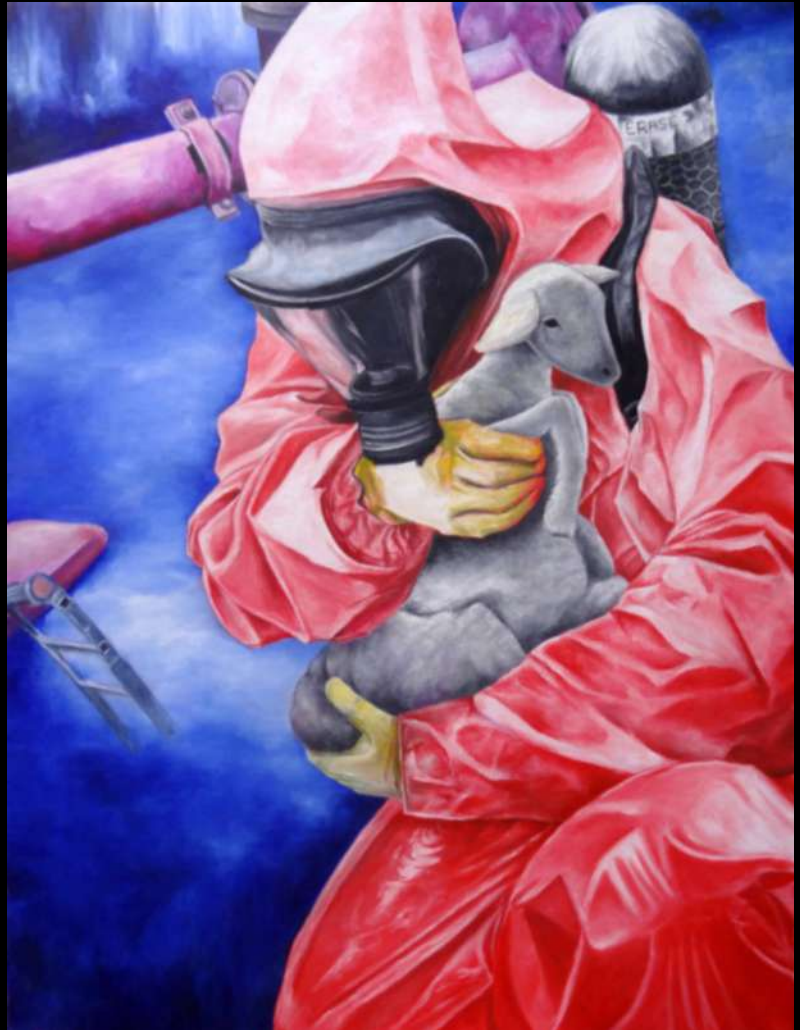
l'agneau égaré , OrdinaryLives, 2015 huile sur toile 116x89 cm