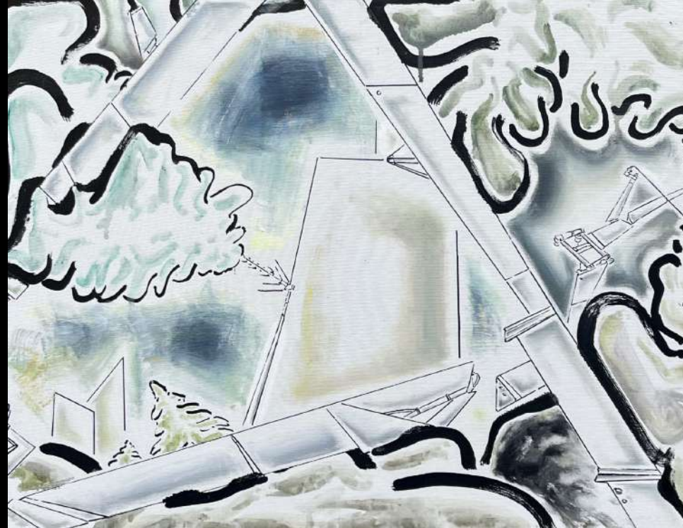
Post-anthropocène, 2024 techniques mixtes sur toile, 50x65 cm