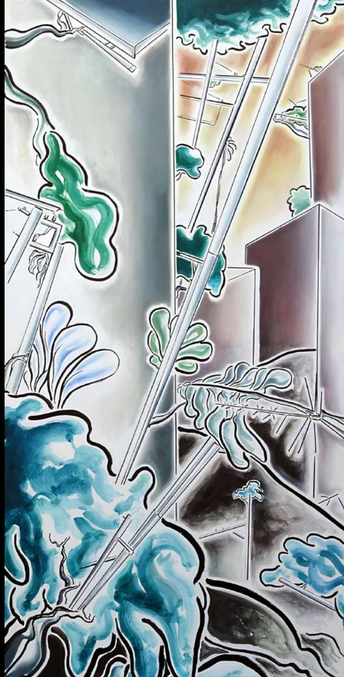
Post-anthropocène, 2023 techniques mixtes sur toile 60x150 cm