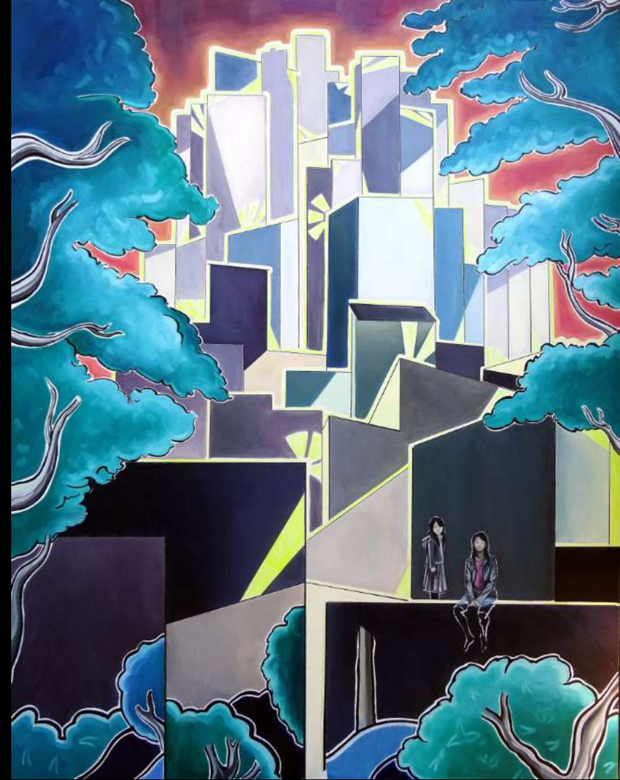
Les Villes jardin , 2019 huile et techniques mixtes sur toile, 114x146 cm