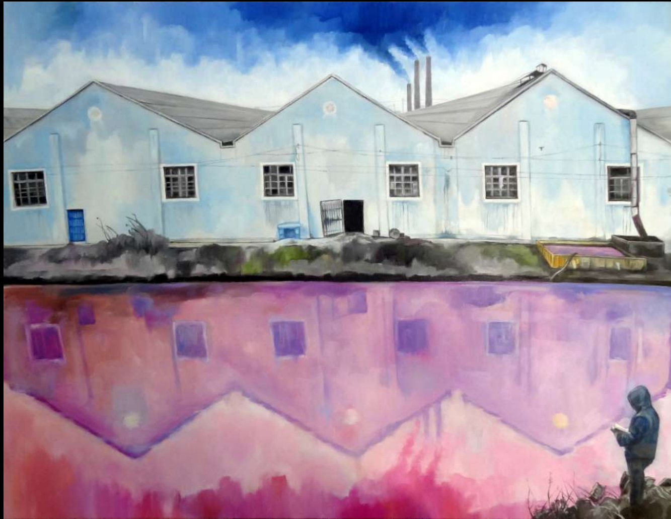
Hangar 17, Denaturation2016 huile sur toile, 116x89 cm