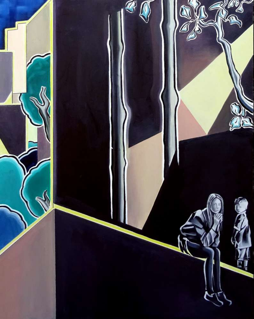
Les Villes jardin , 2019 huile et techniques mixtes sur toile, 73x92 cm